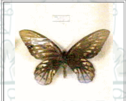
世界最大級のチョウ アレキサンドラトリバネアゲハ