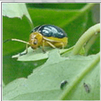
兵庫県下特産の キベリハムシ