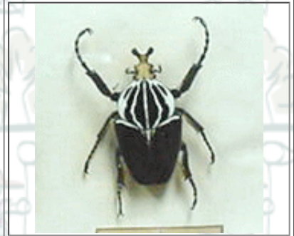
オニコガネムシ アフリカ・コンゴ産