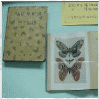
平山修次郎著 原色千種 昆虫図譜