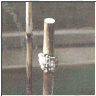
昆虫館の中で生まれた タガメの卵

本館は、水族館型のテラリウム、アクアリウムを用いて、昆虫や水生小動物を飼育展示しており、四季折々のこれらの姿を身近に見ることができます。