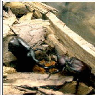
えさを取り合うカブトムシ