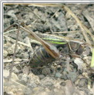
産卵中のキリギリス