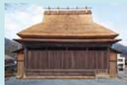
⑤ 上三河の舞台 国指定重要有形民俗文化財の農村舞台。