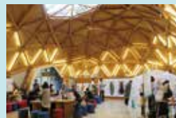
⑨ ひょうご環境体験館 地球温暖化をはじめとする環境問題について「気づき」「学び」「知る」ことができる体験型環境学習施設。