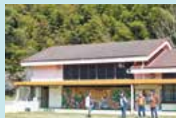
⑩ 赤松の郷昆虫文化館 昆虫と文化をテーマに、昆虫標本や民具、工芸品、玩具などを展示。 ※ 見学は原則土日祝日のみ。 事前に館へ連絡下さい。