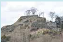
⑦ 利神（りかん）城跡 2017年に国史跡に指定。その威容から、雲突城（くもつきじょう）とも呼ばれる。 ※ 安全のため登城は遠慮下さい。