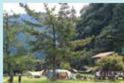
④ 南光自然観察村（キャンプ場） 千種川のほとりにあるオールシーズン対応のキャンプ場。