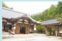
① 船越山 南光坊 瑠璃寺（るりじ） 高野山真言宗別格本山の名刹。