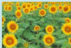
⑥ ひまわり畑（7～8月上旬） 南光地区各地で咲き誇る。7月にはひまわり祭りも。