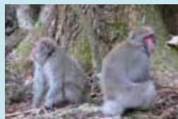
② るり寺 モンキーパーク 野生のニホンザルを観察できる。