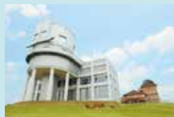
⑧ 西はりま天文台公園 天体観測や宿泊ができる。天文台には、世界最大の公開望遠鏡「なゆた」がある。