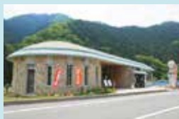
③ 南光ひまわり館 地元食材を使った特産品を製造販売。喫茶軽食コーナーも。