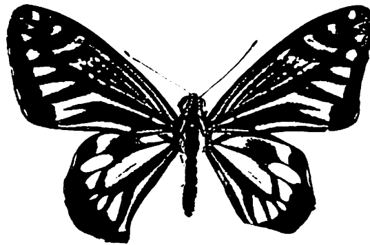
津名町大町で採集した無尾型のナミアゲハ。