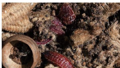
図7. 綿毛を摂食中の幼虫；神戸市相楽園。(2020年10月25日)