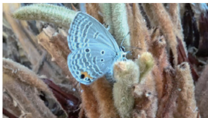
図2. 萌芽への産卵；松波町。(2025年10月14日)