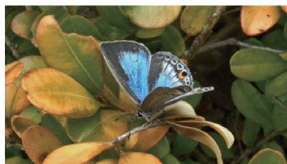
図6. 羽化後間もない♀；松波町。(2025年11月14日)