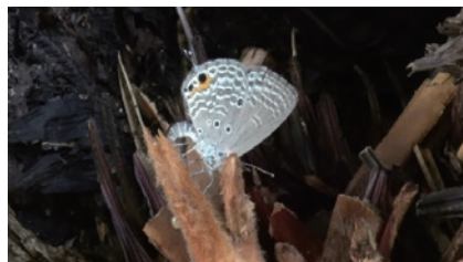
図3. 発芽のない部分に産卵；松波町。(2025年10月19日)