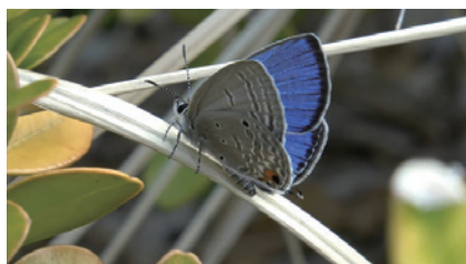
図4. 羽化後間もない新鮮♂；松波町。