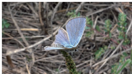
図1. 加古川河川敷で♂を観察。(2025年10月13日)

2025年10月13日の午前11時過ぎ、加古川河川敷（高砂市米田町）の草むらで、多数頭のヤマトシジミ