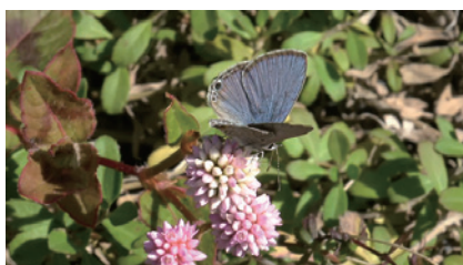
図8. ヒメツルソバで吸蜜；松波町。(2025年11月10日)