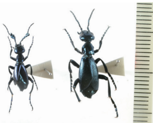
図1 上郡産キュウシュウツチハンミョウ。全形(背面), 左♂, 右♀。

♂は園内に建てられた神社へと上って行くコンクリート路沿いのススキ類をスイープして得た。♀はその神社拜殿のコンクリート床上にひそんでいたものであり、腹部の肥大を認めなかったため、産卵を終えた後の個体かと思われた。これらは同一種とみられ、秋に活動する