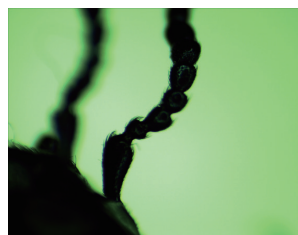
図2 上郡産キュウシュウツチハンミョウ♂。右触角基半部。 図3 上郡産キュウシュウツチハンミョウ♀。右触角基半部。

こと並びに触角第1節が顕著には伸長しないこと等から auriculatus と同定した。