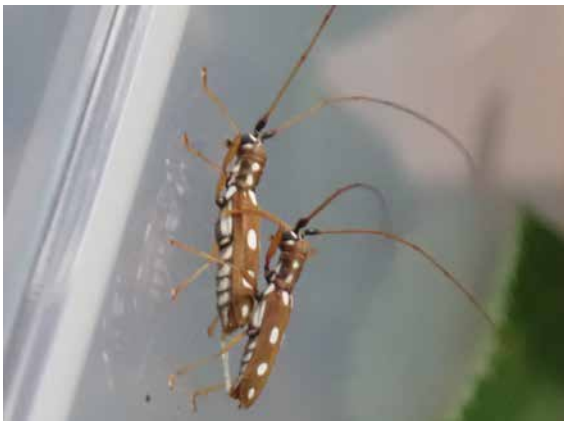
図 16 交尾 2020.6.28 夜.