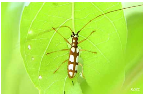
図 28 タカサゴシロカミキリ生態写真 (奄美).

ブログに掲載された奄美のタカサゴシロと北海道のヤツボシシロは、上翅の斑紋や後食痕、黒い糞を葉上に