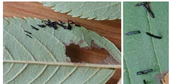
図 19 ヤツボシシロカミキリの糞.