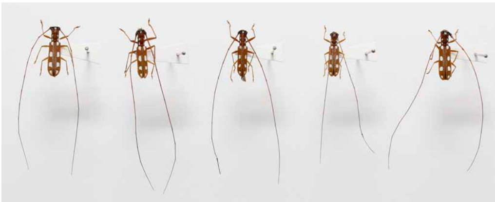
図 20 標本 [9 - 11mm].