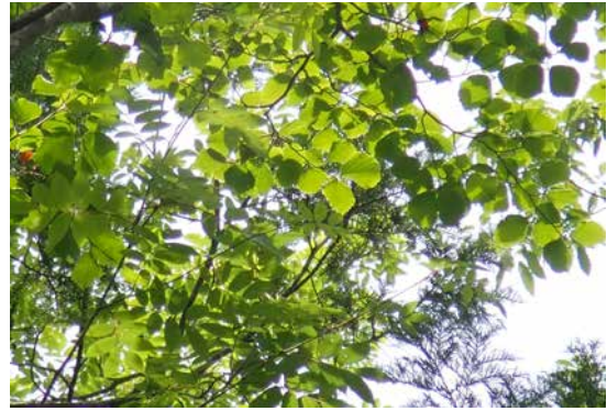
図3 ツシマナナカマドとアズキナシ(本陣山). 近年はアズキナシをアズキナシ属に含め, 学名を Aria alnifolia と表記することもある.

発生木のナナカマドと帰途の道路脇にあったアズキナシの枝葉を, 数本手折って帰宅.