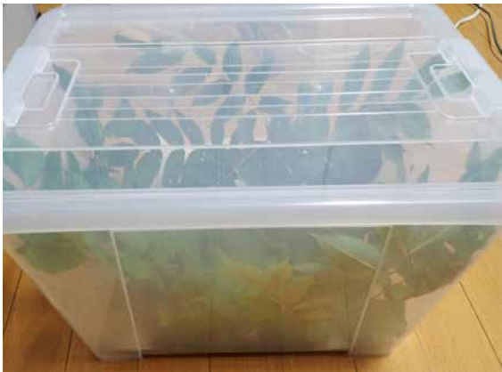
図10 衣装(飼育)ケース.