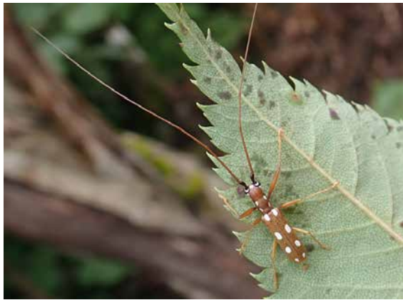
図 25 ヤツボシシロカミキリ (大きな個体)13mm 2020.7.16.