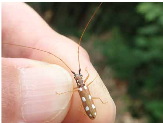
図7 ヤツボシロカミキリ 2020.6.27.