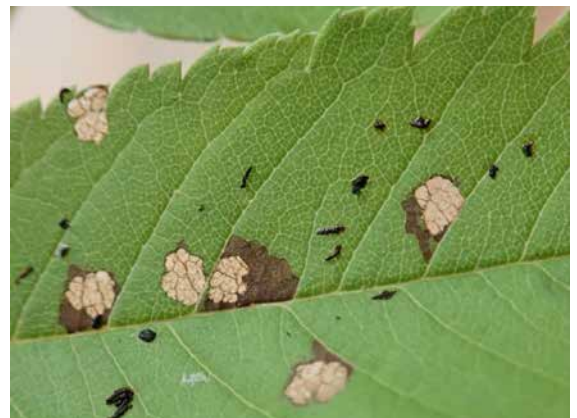
図13 後食痕(ナナカマド葉の表).