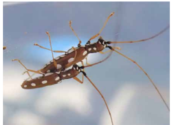
図 17 交尾 2020.6.28 夜.