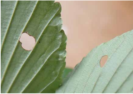
図 14 後食痕(アズキナシ).