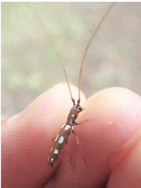
図6 ヤツボシロカミキリ 2020.6.27.