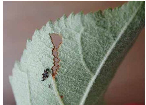
図 15 後食痕(ヒメリンゴ: ズミやエゾノコリンゴの近縁種).