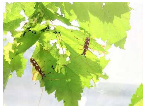
図 29 ヤツボシシロカミキリ生態写真 (北海道).