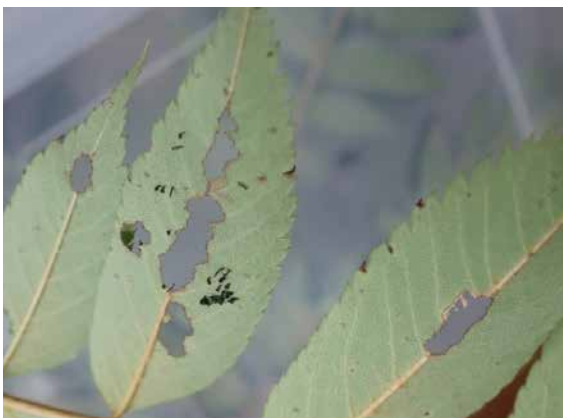
図12 後食痕(ナナカマド).