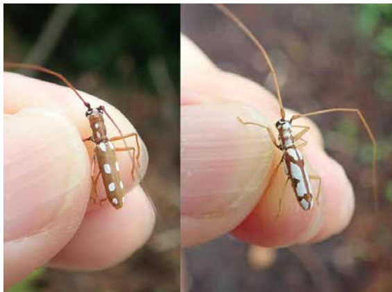
図 27 ヤツボシシロ (図 25) とタカサゴシロ (図 26) の体サイズ比較 2020.7.16.