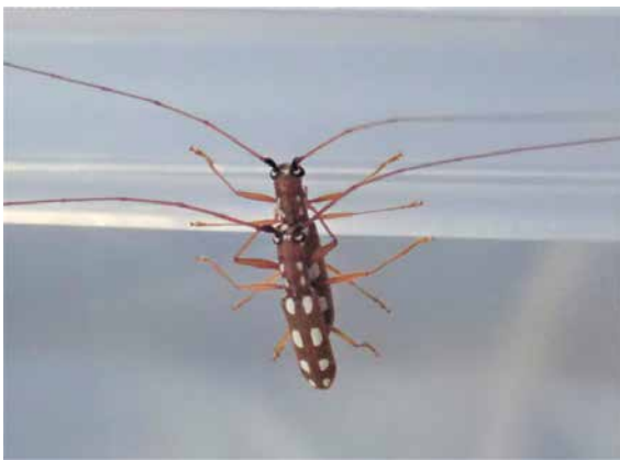
図 18 交尾 2020.6.29 朝.