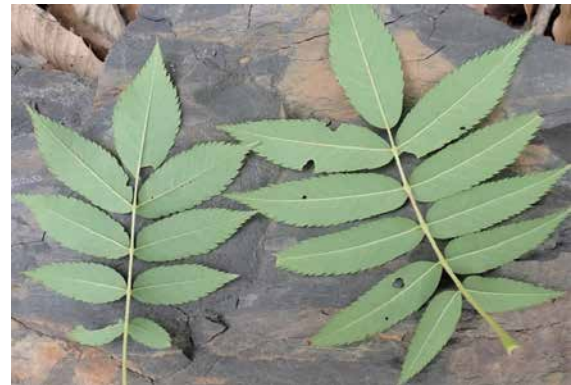
図22 ツシマナナカマド(小葉・裏).

小葉は9-11枚が多く、葉裏に赤褐色の軟毛が密生するというサビバナナカマドの特徴は見られない。(各種文献にはツシマナナカマドとサビバナナカマドの2変種を記載).