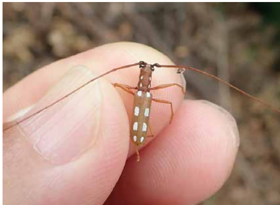
図5 ヤツボシロカミキリ 2020.6.27(触角欠損).