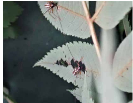
図11 後食の様子(ナナカマド).