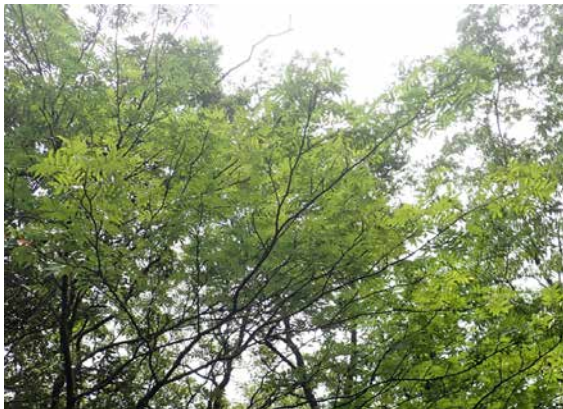
図21 ツシマナナカマド(対馬豊玉町).

帰宅予定の6日から九州地方を豪雨が襲い、対馬空港からは福岡行の最後の便だけが飛び、かろうじて西宮に帰着できた。