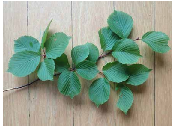
図9 アズキナシの枝葉.