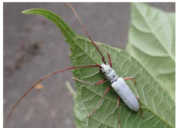
図24 チョウセンシロカミキリ(対馬)2020.7.5.