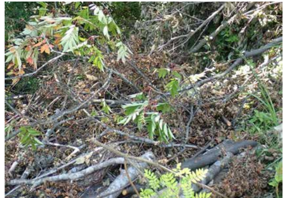
図4 伐採されたナナカマド(兔和野).