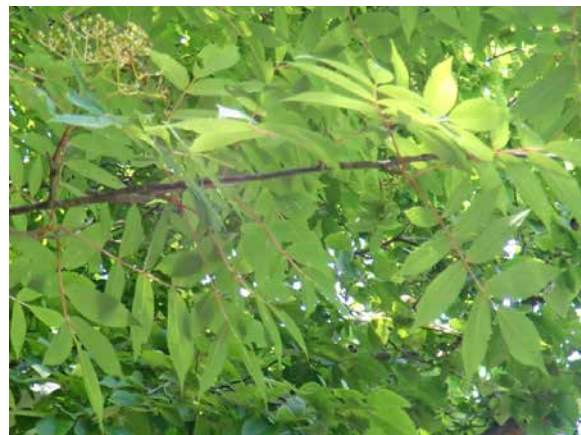
図2 ツシマナナカマド (但馬海岸)。「兵庫県植物目録」ではツシマナナカマドの項に [但馬] 扇ノ山, 氷ノ山, 妙見, 久斗, 床尾とある。