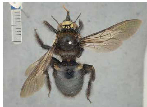
図1 タケクマバチ (オス) 標本写真.