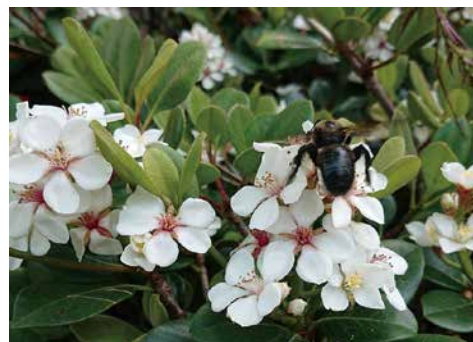
図2 シャリンバイを訪花するタケクマバチ (オス).