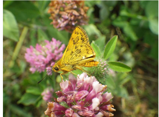
記録：2exs, 兵庫県伊丹市東桑津, 20. VI. 2017.

筆者は2017年6月に新鮮な個体を2個体撮影した。空港に隣接する木立のほとんどない草原である。