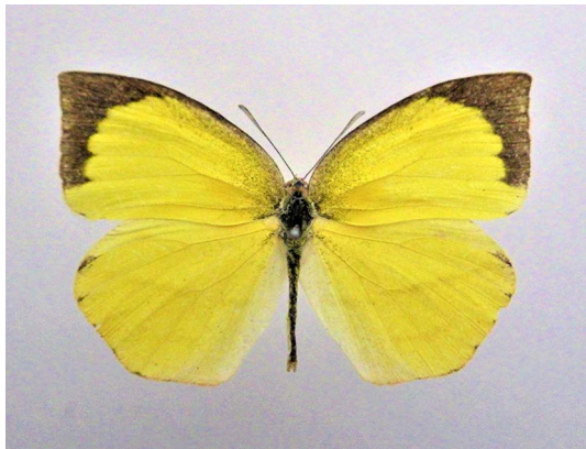
記録：1 ♀, 兵庫県伊丹市東桑津, 30. IV. 2017. 筆者採集