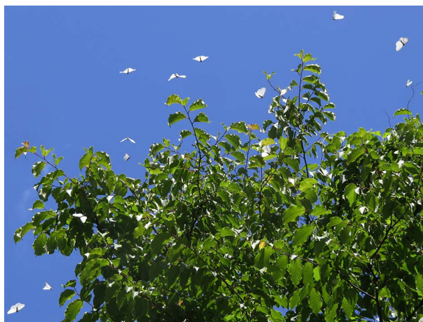
図2 キアシドクガの乱舞 豊岡市日高町稲葉 2017年6月4日。