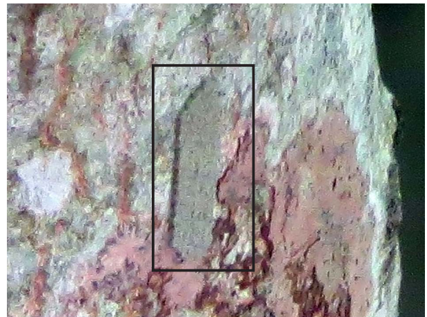
図5 卵塊 朝来市青倉山 2017年6月9日.