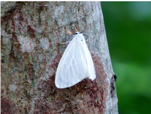
図4 クマノミズキに産卵中 朝来市青倉山 2017年6月6日.