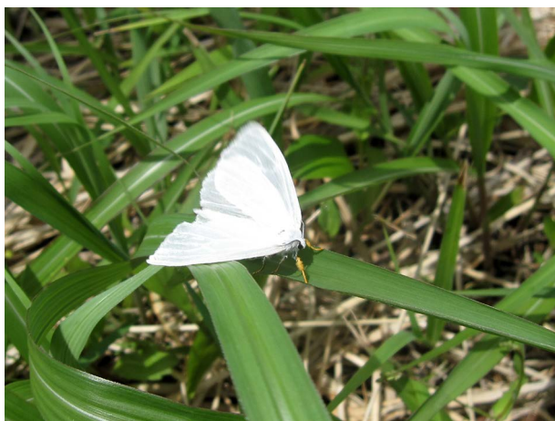
図1 キアシドクガ成虫 養父市鉢高原 2017年6月2日。