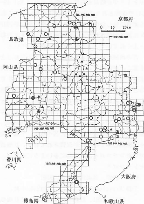
兵庫県におけるオオセンチコガネとセンチコガネの分布概念図

センチコガネ：津名郡岩屋。洲本市先山、曲田山、中川原町、三熊山。三原郡諭鶴羽山。川辺郡猪