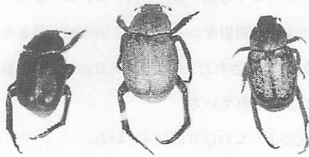
クロアシナガコガネ

ここでの分類は若干混乱しているようで H. moerens そのものは本州、九州に分布として産地が Hiogo, Nagasaki, Mt. Unzen しか掲げられてなくラインアシナガコガネ (var. reini Heyden) が本州、四国、九州に分布として多くの産地を