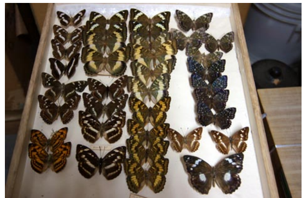
写真1 仁禮景雄コレクション(九州大学農学部昆虫学教室所蔵)。

仁禮景雄は明治18年10月10日に生まれた。父は景範。良く知られているように、仁禮景範は薩摩藩出身の海軍中将で、参謀本部海軍部長、横須賀鎮守府長官、海軍大臣などを歴任した明治海軍建設の功労者である。その功でもって明治17年に子爵の爵位を授けられた。ただ、従来、景雄は景範の三男とされていたが、巖