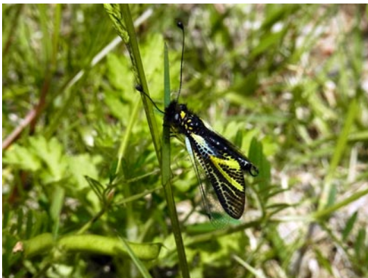
図3 2014年5月4日, 赤穂郡上郡町