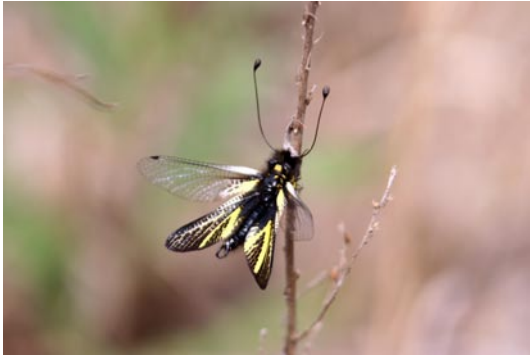
写真1 2007年4月29日, 姫路市飾東町