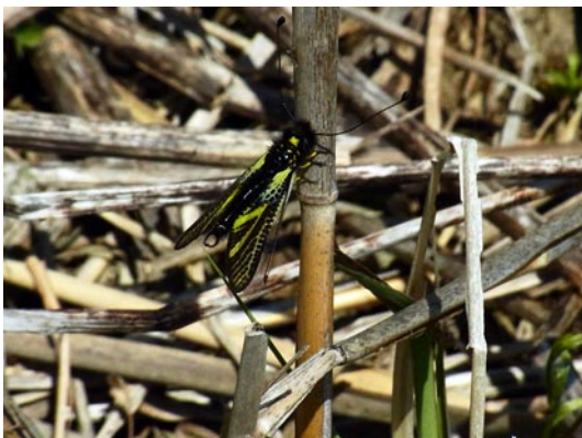
図4 2014年5月4日, 赤穂市西有年