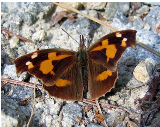
写真1 テングチョウ成虫。

成虫は5月下旬ごろから発生し、6月下旬ごろから急に見られなくなります。夏の間は休眠して9月下旬ごろ少数の活動が見られますが、11月には再び休眠し、越冬後の翌春から活動を始め、4月ごろにエノキ、エゾエノキの新芽に産卵してほとんどが5月中に姿を消します。卵から孵化した次世代の幼虫はエノキの葉を食べて成長します。5月には葉裏で蛹になり、5月末から成虫が羽化します。