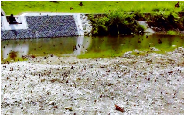
写真2 テングチョウの大集団. 2014年6月7日, 兵庫県たつの市新宮町牧.

発生場所が集中しているのは, 兵庫県の神戸市六甲山周辺, 西播磨地域, 大阪府北部地域です.