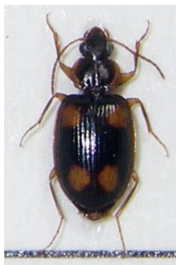
13. コヨツボシアトクリゴミムシ