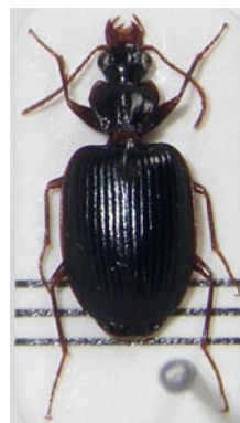
14. ヤセアトクリゴミムシ