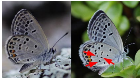
1 ex. (斑紋異常個体, 写真左), 兵庫県たつの市, 12. IX. 2012

兵庫県たつの市で、筆者が撮影した複数のクロツバメシジミ Tongeia fischeri のうち、1頭に一部の斑紋の消失が見られたので報告する。