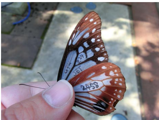
図 1 佐用町昆虫館で再捕獲された長野県からの移動個体。