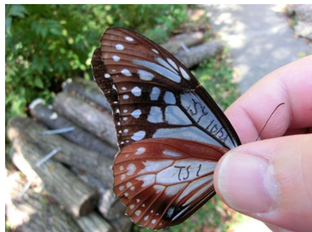
図 2 佐用町昆虫館で再標識されたアサギマダラのオス。