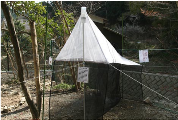
図2 マレーゼトラップの設置状況。

定点以外にも近隣の船越山奥の院において電池式のブラックライトを使用した簡易なライトトラップを実施し、また昆虫館の灯火に飛来したのも確認されたので、その記録も本調査と併せて報告する。