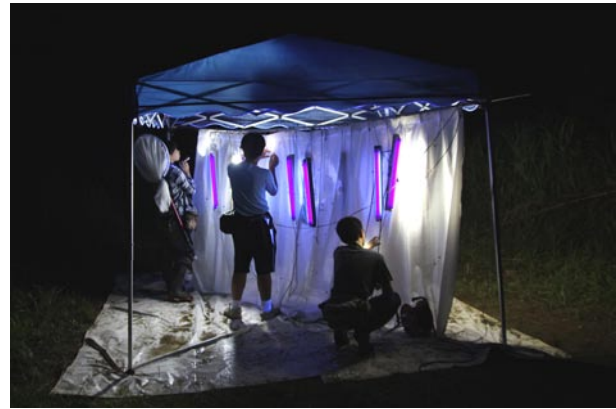
図3 ライトトラップを用いた採集の様子。

20科 92種 496個体が記録された。これ以外にコマユバチ科, ヒメバチ科, クモバチ(ベッコウバチ)科などに属する種が多く採集されているが、同定困難もしくは