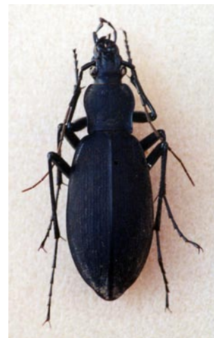
図1 最初に発見したクロナガオサムシ♀(石楠花山南西中腹)