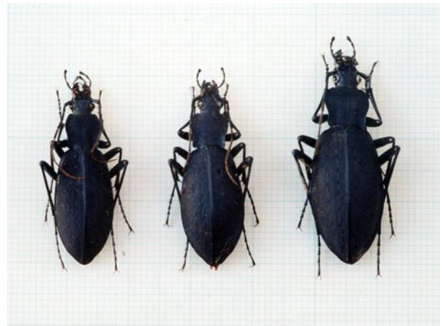
図5 クロナガオサムシの体長比較(♀) 左:三国岩(790m), 中:石楠花山山頂付近(650m), 右:猪名川町大野山(600-750m)

しかし、この小型化の原因については、発生の中心高度が600~700mとしても、クロナガオサムシの全国的な分布状態から見て、特に標高が高いとは言えず、このように顕著に小型化した原因が、一般に高度が上がると小型化するという要因だけでは考えにくい。この問題については曾田氏の論文*9を参考にしながら研究を深めていきたい。