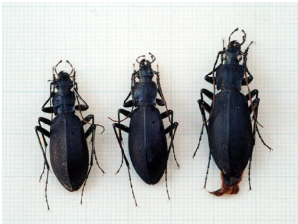
図4 クロナガオサムシの体長比較(♂) 左:山の街(320m), 中:石楠花山烏帽子岩(610m), 右:猪名川町大野山(600-750m)