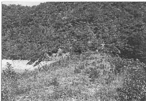
写真-1 有年大池土手の生息環境

2004年9月11日に証拠標本を得るために再び現地を訪れた。環境は2年前とほとんど変わっておらずカヤコオロギも多