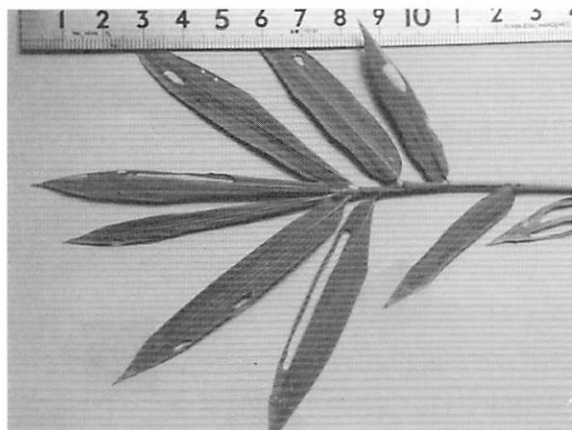
写真-2 ネザサにみられる食痕

2004年9月11日に赤穂市の有年大池を訪れた際にカヤコオロギの摂食行動を確認することができたので少しふれておきたい。ここでは、多数の本種が生息しているので、しばらく観察していると、15時15分にネザサの葉の上面に静止し、葉の表面をなめるような行動をとっている雌個体が目撃できた。その行動はしばらく続き、やがて葉の中心に穴があいた。ここから、さらに摂食を続け、15時50分まで続いた。後で、周辺に生育しているネザサを見てみると、葉の中央部付近に楕円形状ないしは長楕円形状の穴があいている葉が多数確認された(ただし、中央脈部分は避けている)。これらは、おそらくカヤコオロギの食痕である可能性が高いと考えられた。実際に摂食行動を観察したのはこの1例だけであったが、葉の縁からではなく、葉の中央付近から摂食を始めることに興味深く感じた。ネザサの食痕については、写真-2に示した。